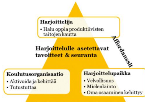
Kuvio 2. Kotoutumiskoulutukseen sisältyvän työelämäjakson toimijoiden tavoitteisto

tarkastella tiedon karttumisen, taitojen kehittymisen ja asenteissa tapahtuvien muutosten kautta (Rouhiainen-Neuenhäuserer 2009). Harjoittelijat nostivat esiin nimenomaan kielenkäytön viestinnällisen merkityksen. Koulutuksen tarjoavan oppilaitoksen tavoitteena on aktivoida oppijaa ja tutustuttaa hänet suomalaiseen työelämään. Harjoittelupaikan eli Vaasan yliopiston kielikeskuksen näkökulmasta tavoitteena ja myös velvollisuutena on vastuunkanto ulkomaalaistaustaisten henkilöiden kieli- ja viestintätaitojen oppimisesta ja niiden myötä korkeasti koulutettujen ulkomaalaistaustaisten henkilöiden työllistymisestä Suomessa.